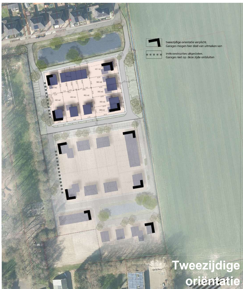
Figuur 7 Tweezijdige oriëntatie

Hoeken van rijwoningen grenzend aan de openbare ruime, maar ook van vrijstaande of twee-onder-een-kap-woningen zijn zeer bepalend voor zowel de beleving(swaarde) van de woonstraat als de sociale controle vanuit de woningen op die woonstraat. In dit plan worden daarom blinde zijgevels van hoekwoningen uitgesloten. Het doel is om het wonen achter de hoekgevel te betrekken bij het leven op straat. Er moet dus sprake zijn van een mogelijke interactie tussen binnen en buiten zonder dat de leefbaarheid binnen daarmee wordt aangetast. Dit betekent dat er minimaal sprake moet zijn van één raam in zijgevel. Afhankelijk van het type woning kan ook de voordeur aan deze zijde bijdragen aan dit doel. Garages mogen op de hoek gebouwd worden. Ook hier geldt dat geen sprak mag zijn van een blinde gevel. Garages georiënteerd met een uitrit richting de begraafplaats zijn uitgesloten. Extra detailleringen in het metselwerk (bijvoorbeeld door afwijkend kleurgebruik) kunnen de belevingswaarde nog vergroten.