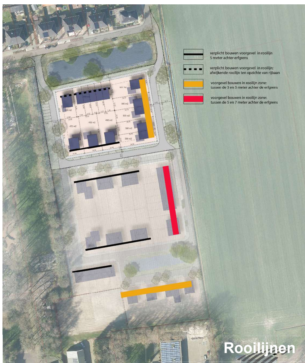
Figuur 6 Rooilijnen

In principe worden alle woningen verplicht in de rooilijn gebouwd, die 5 meter achter de erfgrans is gesitueerd. Hierdoor hebben alle woningen een ruime voortuin die past in het beeld van het dorp. Alleen in de dorpsrand is hierop een uitzondering gemaakt. De voorgevels van deze woningen aan de dorpsrand mogen binnen een vrije bandbreedte worden gerealiseerd. Deze flexibiliteit biedt de mogelijkheid om (door toeval op basis van de keuze van de bewoners) meer gewenste variatie in het aanzicht van de dorpsrand te realiseren. Daar waar het openbaar groen in het straatprofiel aanwezig is, is deze zone smaller dan waar dat niet het geval is. Hiervoor is gekozen om bij opgaande gewassen op het aangrenzende buitengebied het mogelijke profiel met ondiepe voortuinen niet te smal te maken.