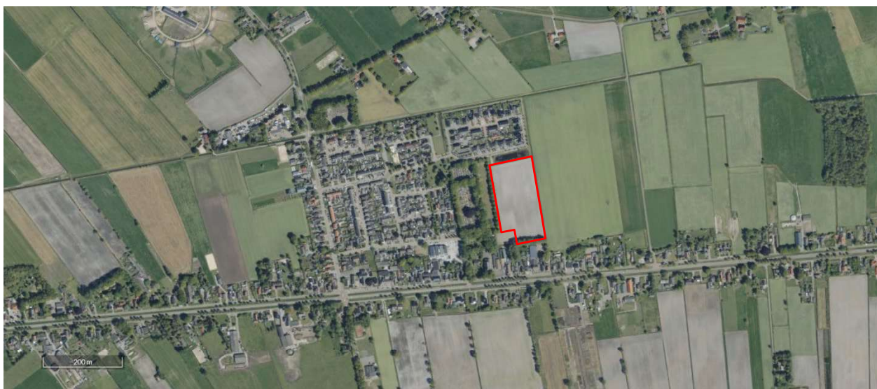
Figuur 1 Plangebied

De Wieken II vormt als woningbouwlocatie de volgende fase in de uitbreidingslocatie voor de Lutten. Voor deze fase is door de gemeente Hardenberg een stedenbouwkundig plan ontworpen, een bestemmingsplan en een beeldkwaliteitsplan opgesteld. Bij ontwerp-/ontwikkelopgaven in dit plangebied, dient dit rapport, het beeldkwaliteitsplan De Wieken II, samen met het bestemmingsplan als basis voor de gewenste ruimtelijke ontwikkeling.