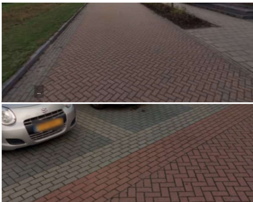
Figuur 10 materialisering openbare ruimte (rijbaan en parkeerplek) aansluitend bij eerste fase