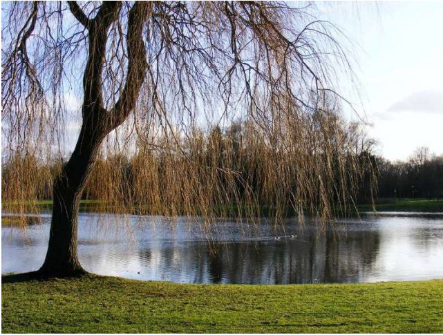
Figuur 11 Bij een vijver passende boom

In de woonstraten worden in het profiel bomen opgenomen die passen in het straatbeeld. Dit worden laanbomen, afwijkend van de solitaire bomen rond de vijvers in soort en maat (kleiner).