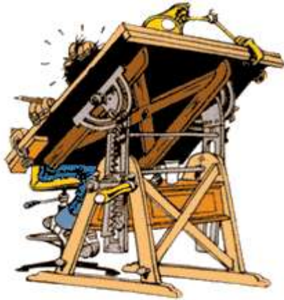
Figuur 2 ontwerpkaders