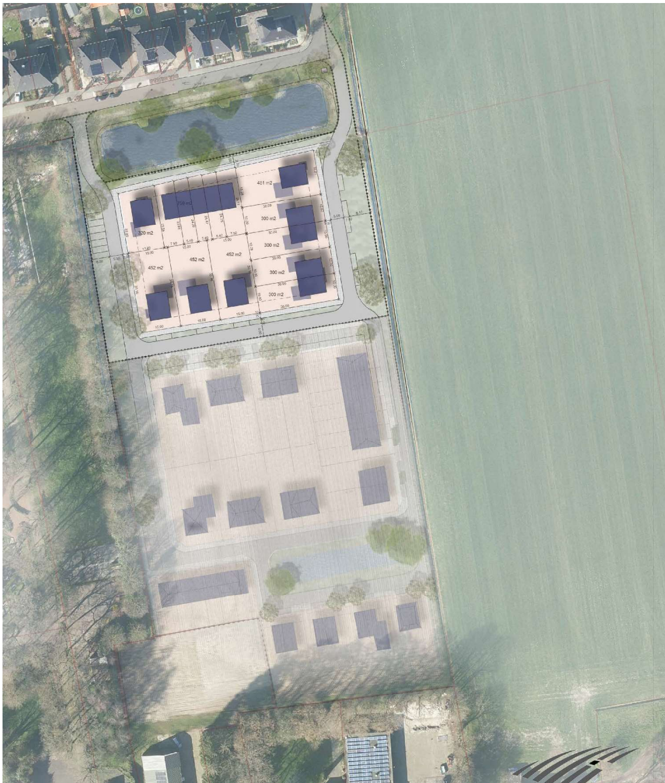
Figuur 4: Stedenbouwkundig plan met indicatieve verkaveling