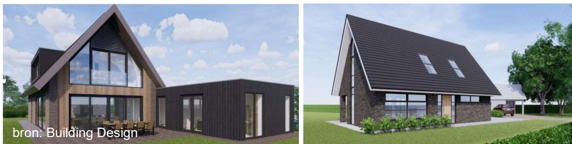
Figuur 5 referentie beelden 'eigentijdse architectuur'