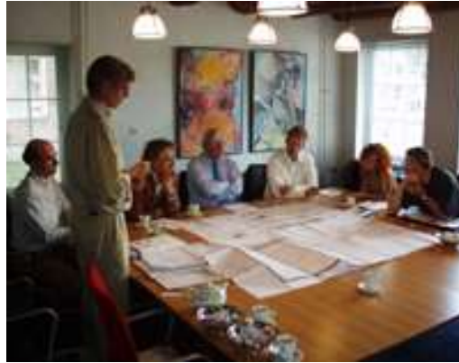
Figuur 3 toetsingskaders