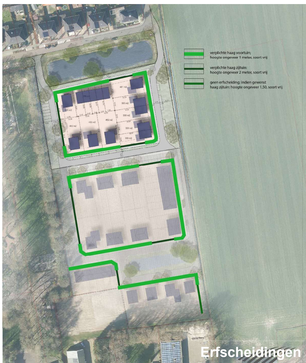
Figuur 9 Erfscheidningen

Uitzondering hierop vormt de kavel die aan de zuidoostzijde van het plan grenst aan het buitengebied. Een erfscheiding is hier niet verplicht in verband met het vrije uitzicht op het buitengebied. Indien hier toch behoefte is aan een erfscheiding, is ook hier sprake van een haag (hoogte ongeveer 1,5 meter, soort vrij).