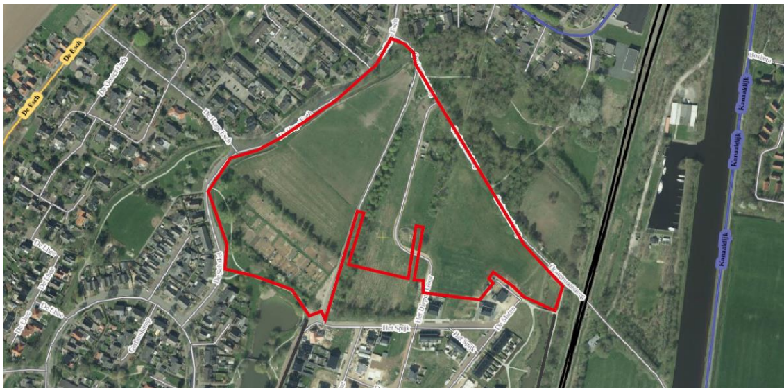
Figuur 1.1: Plangebied Garstlanden IV.

Aan de bodemparagraaf in dit nieuwe bestemmingsplan liggen de bodemonderzoeken die in 2010 door DHV 12 voor Garstlanden III zijn uitgevoerd ten grondslag. De gemeente Hardenberg gaat hiermee akkoord mits dit wordt aangevuld met een onderbouwing in de zin van een kort historisch onderzoek. Daarnaast moet er nog specifiek aandacht worden besteed aan de mogelijke aanwezigheid van arseen in de grond en de omgang hiermee als de grond vrijkomt.