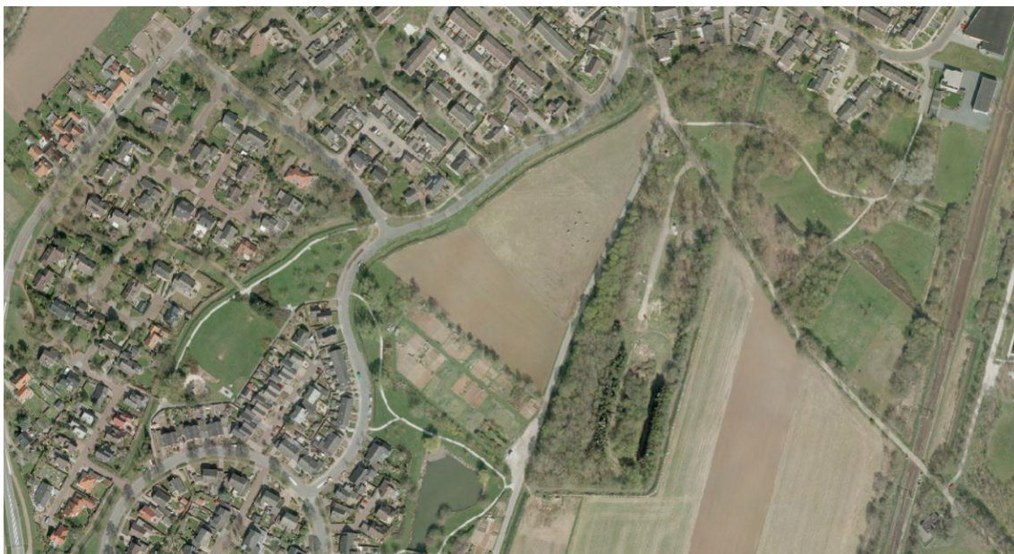
Figuur 3.1: Luchtfoto plangebied 2010

Uit de beschikbare gegevens komen er in deze periode geen verdere activiteiten naar boven die hebben plaatsgevonden in het plangebied en een negatieve invloed hebben gehad op de bodemkwaliteit aldaar.