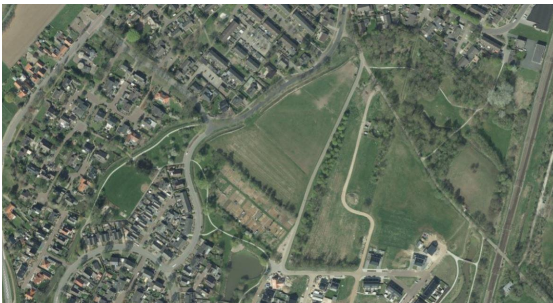
Figuur 3.2: Luchtfoto plangebied 2018