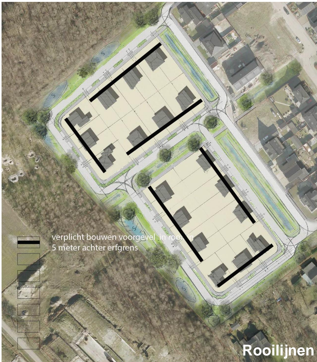
Figuur 5 Rooilijnen

Alle woningen worden verplicht in de rooilijn gebouwd. Deze is gelegen op 5 meter achter de erfrens. Op deze wijze wordt de blokverkaveling met de rechte en orthogonale lijnen versterkt doordat ook de hoofdgebouwen in zichtbare rechte lijnen zijn geplaatst.