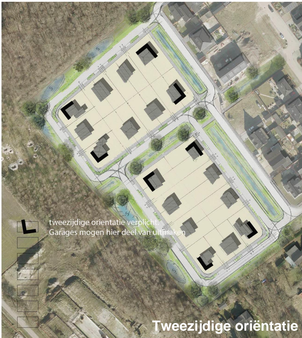
Figuur 6 Tweezijdige oriëntatie

Extra detailleringen in het metselwerk (bijvoorbeeld door afwijkend kleurgebruik) kunnen de belevingswaarde nog vergroten.