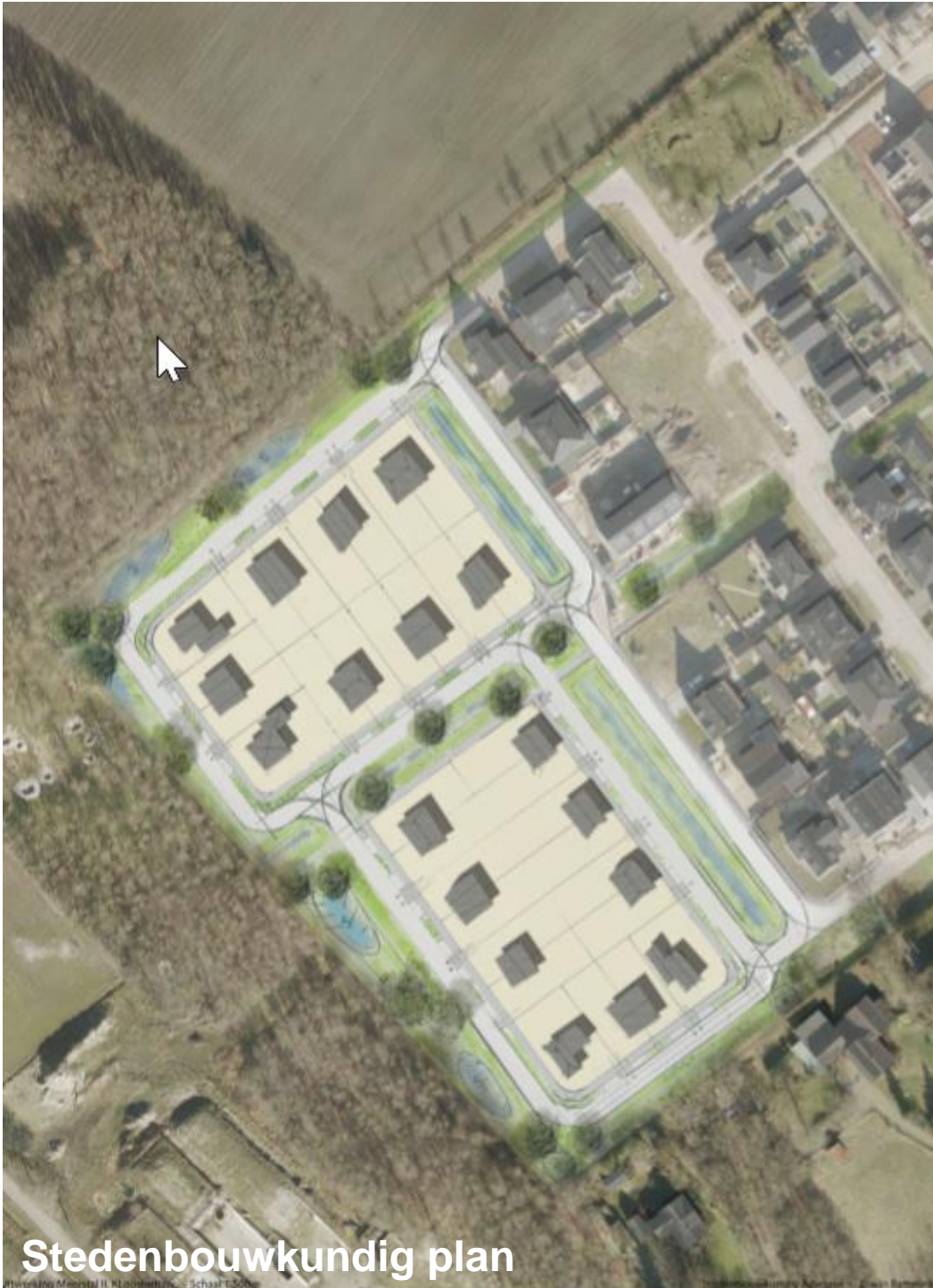
Figuur 4 Stedenbouwkundig plan met indicatieve verkaveling

daar slechts sprake van een trottoir aangezien hier de zijkanten van woningen op deze zone georiënteerd zijn. In dit plan wordt het regenwater zichtbaar afgekoppeld.