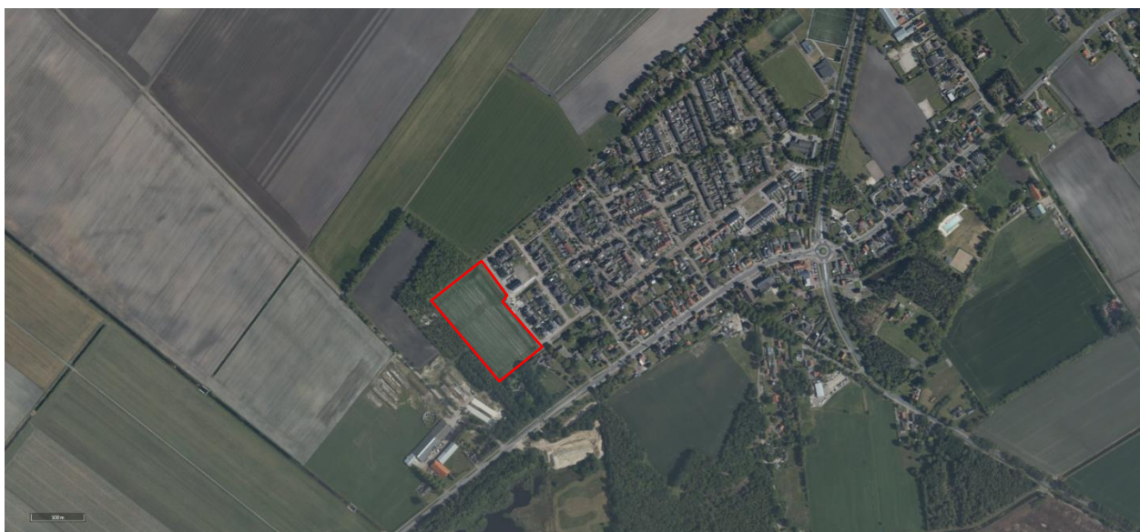
Figuur 1 Globale markering plangebied

Meerstal II vormt de volgende fase in de uitbreidingslocatie voor Kloosterhaar. Voor deze fase is door de gemeente Hardenberg een stedenbouwkundig plan ontworpen, een bestemmingsplan en een beeldkwaliteitsplan opgesteld. Bij ontwerp-/ontwikkelopgaven in dit plangebied, dient dit rapport, het beeldkwaliteitsplan Meerstal II, samen met het bestemmingsplan als basis voor de gewenste ruimtelijke ontwikkeling.