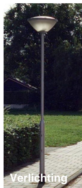
Figuur 9 materialisering Meerstal fase 1