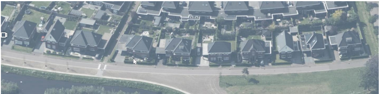
Figuur 7 haaks of evenwijdige nokrichtingen mogen elkaar afwisselen ten behoeve van de gewenste variatie

In een kap is het mogelijk accenten aan te brengen (bijvoorbeeld in de vorm van dakkapellen of haaks op de nokrichting staande kapjes).