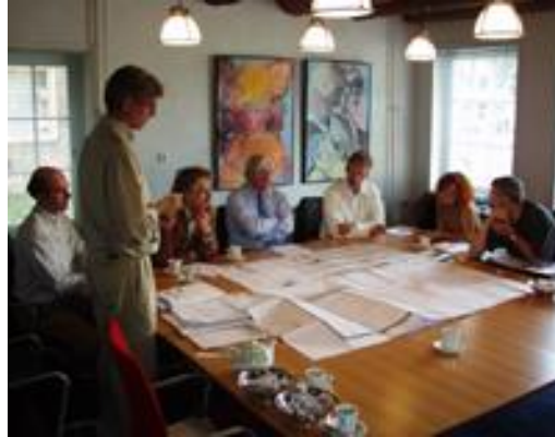
Figuur 3 ontwerpaders