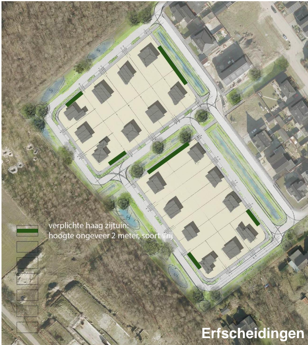
Figuur 8 Erfscheidingsen