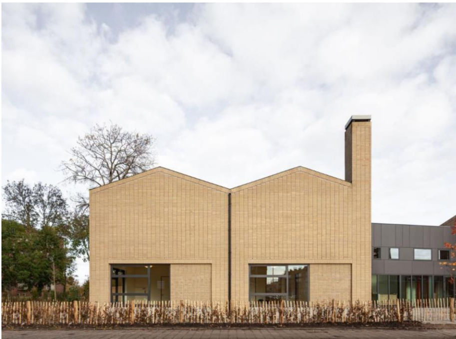
figuur 3, herkenbare, heldere hoofdvorm